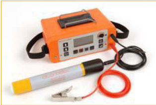
Covermeter P 331 with Half-Cell

Macben P 331 dekkingmeters met Half-cel staan toe de plaats, richting, diepte en diameter van wapeningstaven te bepalen, maar ook de potentiële corrosie. Alles in één eenvoudig te gebruiken meter.