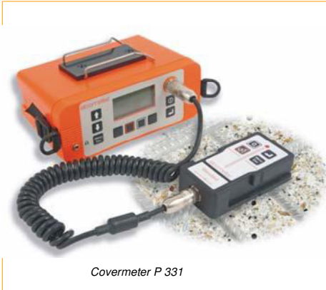
Covermeter P 331