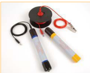
Covermeter P 331 Half-Cell Kits

Dankzij hun uitgebreid geheugen kunnen de meters tot 240,000 dekking en Half-Cel metingen zij aan zij opslaan. De P 331 Dekkingmeter met Half-cel, verkrijgbaar in BH, SH en TH uitvoering, is waarschijnlijk de meest veelzijdige en rendabele dekkingmeter op de markt.