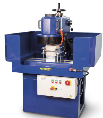
C298/ C299 avec C300-06N

Même accessoires que pour le modèle C299